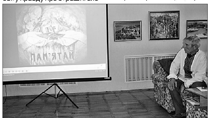
Презентація книги О.Джуня в Миргородському краєзнавчому музеї.

у 1986 р. вдалося створити спеціальну комісію Конгресу США для проведення слухань з питання голодомору в Україні 1932-1933 рр. Виконавчим директором комісії став відомий дослідник, викладач Гарвардського університету Дж. Мейс, хоча ще з 1984 р. молодий американський учений Л. Герец почав збирати свідчення людей, які пережили трагедію і залишилися живими. Уже перші результати роботи комісії Конгресу розкрили жахливі масштаби голодомору. Тоді ж на прохання української діаспори відомий англійський журналіст та дослідник Роберт Конквест узявся за дослідження теми радянської колективізації та терору голодом. Допоміжну роботу з опрацювання джерел узявся зробити згадуваний Джеймс Мейс. Під час досліджень було використано і матеріали так званого "Смоленського архіву", захопленого гітлерівцями у 1941 р. і який згодом опинився в США. А вже в кінці 1986 р. за результатами досліджень у Лондоні вийшла книга Роберта Конквеста "Жнива скорботи: радянська колективізація і голодомор". Дослідження всебічно розкривало правду про геноцид проти українського народу, насамперед, його штучність та спланованість радянським тоталітарним режимом. Фактично Конквест і Мейс здійснили своєрідний науковий подвиг, оскільки не тільки сповістили світ про трагедію, про геноцид проти українського народу, а й зробили це тоді, коли і Радянський Союз, і багато країн на Заході заперечували навіть сам факт існування голодомору в 30-х рр. XX ст. в Україні. Це дійсно були люди правди.