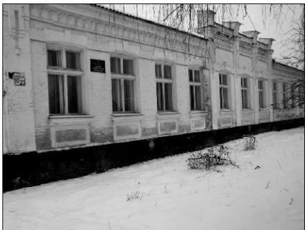
Столітній будинок сьогодні.

Перше училище діяло на Личанці, друге – на вулиці Гоголя, біля волосної управи (район крупозаводу), третє – у Ліску, четверте – у правобережній частині міста. Перше училище на Личанці існувало з 1898 року і спочатку містилося в найманому приміщенні. Будинок був затісний для великої кількості личанських дітей, тож 1915 року для школи було споруджено новий просторий будинок.