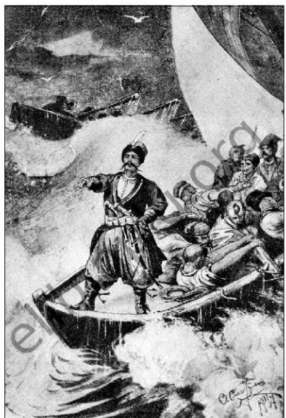
Іван Підкова. Худ. О. Сластион.

Подальша історія козацтва та Миргородського полку було пов'язано з постійною боротьбою козаків за затвердження своїх станових приві-