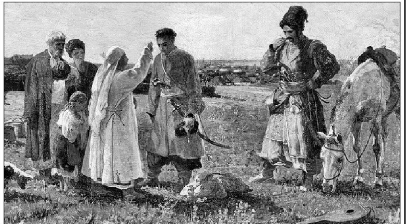
Проводи на Січ. Худ. О. Сластион. 1898 р.

Однак, пройшовши складний і тривалий шлях свого становлення