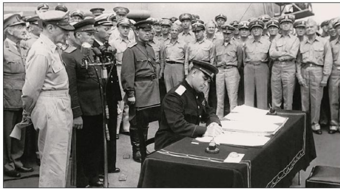
На цьому II світова війна скінчилася.

Із осені 1941 року наші війська з важкими боями відступали з Миргородського району. В урочищі Шумейковому Лохвицького району в оточенні ще знаходилися військові частини Червоної Армії, які різними шляхами намагалися вирватися з цього козана. Ті бійці, яким поща-