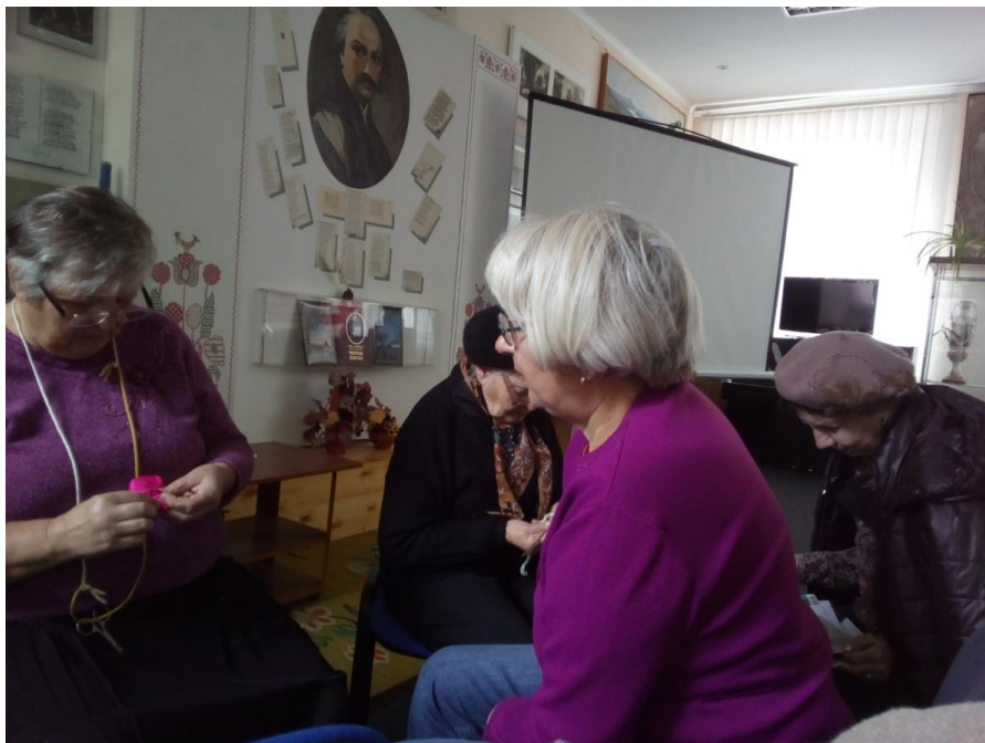
Гурток плетіння гачком

Протягом 2019 року проведено 119 заходів (44 лекції, заняття гуртків, культурно – масові заходи з нагоди визначних дат) та опубліковано 58 публікацій в засобах масової інформації про роботу відділення.