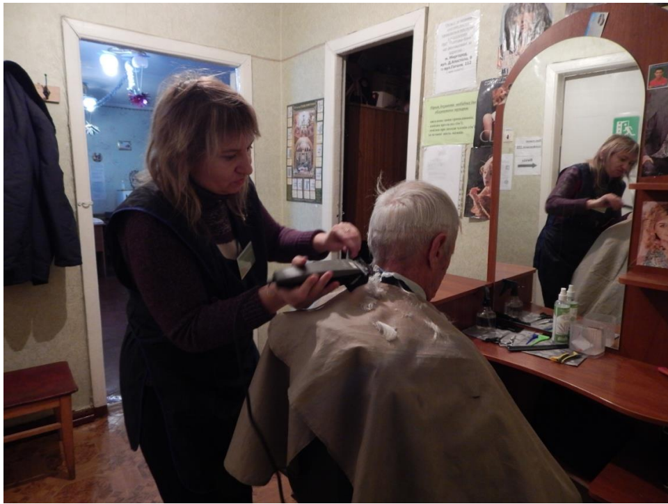
Надання послуг перукарем відділення

Вартість платної послуги перукаря в 2019 р. становила : чоловіча стрижка - 13 грн.40 коп., жіноча стрижка – 19 грн. 95 коп.; 2020 р. чоловіча стрижка - 18 грн.70 коп., жіноча стрижка – 27 грн. 70 коп.