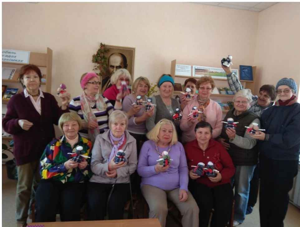
Виготовлення ляльки мотанки

Протягом 2019 року проведено 119 заходів (44 лекції, заняття гуртків, культурно – масові заходи з нагоди визначних дат) та опубліковано 58 публікацій в засобах масової інформації про роботу відділення.